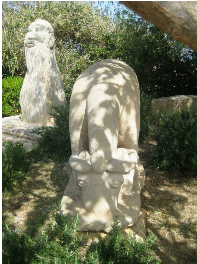
Πάρκο Γλυπτικής «Πετραίων» και Πάρκο Καμήλων, περιοχής Μαζωτού – Sculpture Park “Petreon” and Camels Park, Mazotos area